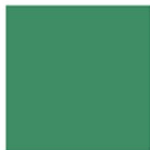
RAMARRO GREEN PAN 3415C