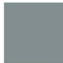
ARDESIA GREY RAL 7001