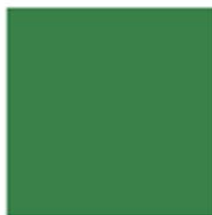
ICARO GREEN RAL 6024