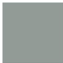
NILO GREY RAL 7042