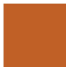
TERRA OCHRE PAN 471C