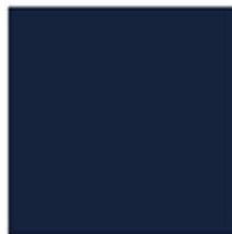
ROSSINI BLUE RAL 2767C