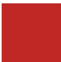
PEPPER RED PAN 1797C