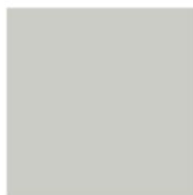
MUS GREY PAN Cool Grey 4c