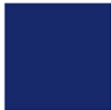
ALGHERO BLUE PAN 280C