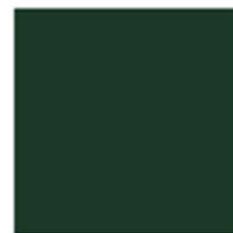
PLANET GREEN RAL 6005