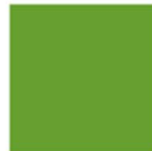
LOREN GREEN RAL 6018