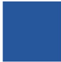
SUMMER BLUE PAN 2728