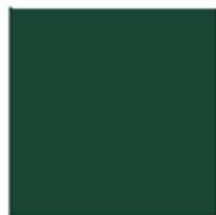
TURANDOT GREEN PAN 3302C