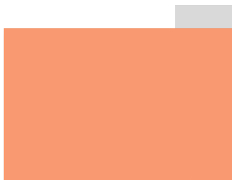
SALMON REMAP SIMILAR TO PAN 713U