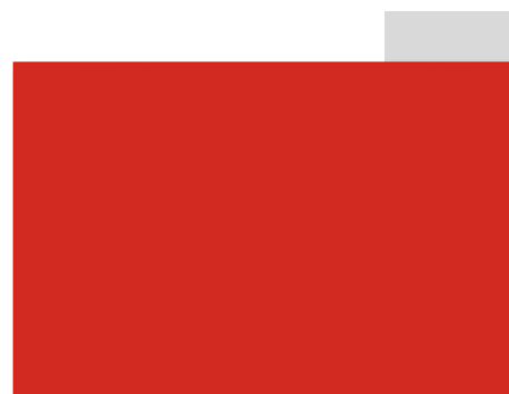
RACE RED REMAP SIMILAR TO PAN 032U