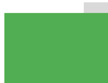
LEAF GREEN REMAP SIMILAR TO PAN 368U