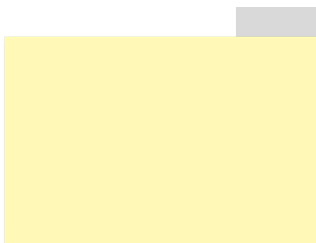
SET-UP YELLOW REMAP SIMILAR TO PAN 7401U

El tipo de PVC y la cantidad de dióxido de titanio utilizados en el proceso de transformación pueden afectar la intensidad del color final.