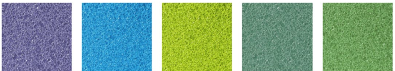
BLUE LILA Rd 0,288 Be 0,195