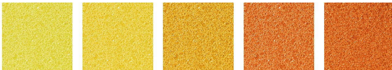
SULFUR Yw 0,043 Rd 0,002