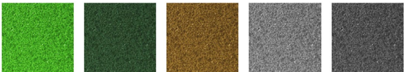
MINT Gn 0,250